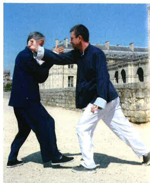
Esquive et contre sur une attaque en coup de poing