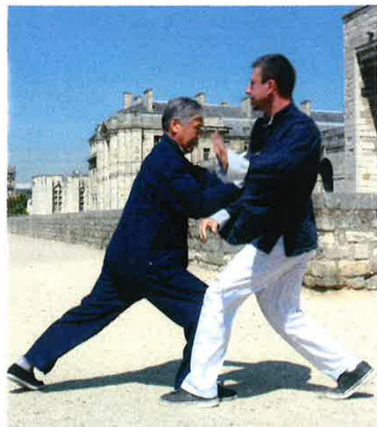
notez la puissance de maître Tung.

sa base. Car il vient régulièrement superviser la pratique du style en Asie et en Europe, notamment en France, Italie, Sicile, Danemark, Finlande, Suède, Grèce. Il y a aussi des élèves de son style en Allemagne, Espagne, Russie... Partout, il est tenu en haute estime pour son art, et pour son ardeur inépuisable à dispenser son enseignement. Ses élèves apprécient la cohérence de son style, qui inclut tous les aspects de cette pratique martiale. Outre la forme Yang et la forme Hao, longues, la forme rapide et la forme familiale Tungjia, rapide et lente, le Hu-Ling Tai Chi-Gong, Tung transmet de magnifiques Tuishou, et Tuilian codifiés en face à face, divers enchaînements de sabre,